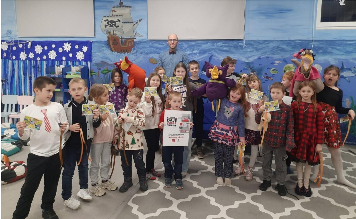
Spotkanie z Panem Poetą