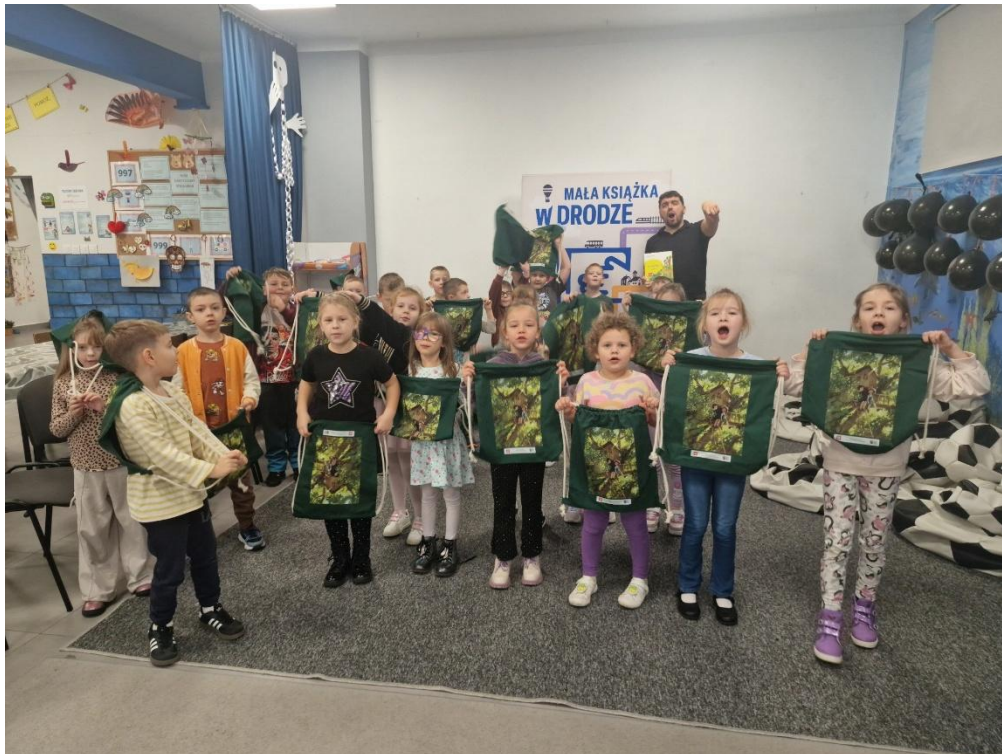
Mała książka – wielki człowiek