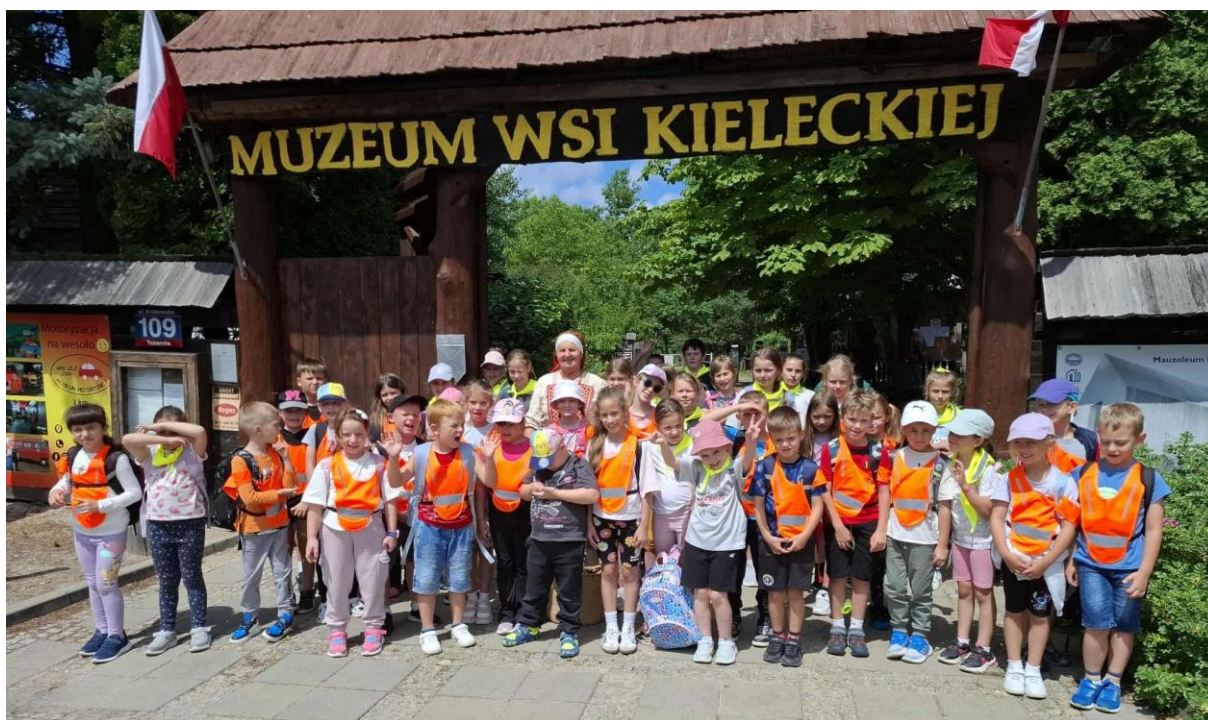
Wakacje w bibliotece

- rajd rowerowy „Odjazdowy Bibliotekarz”