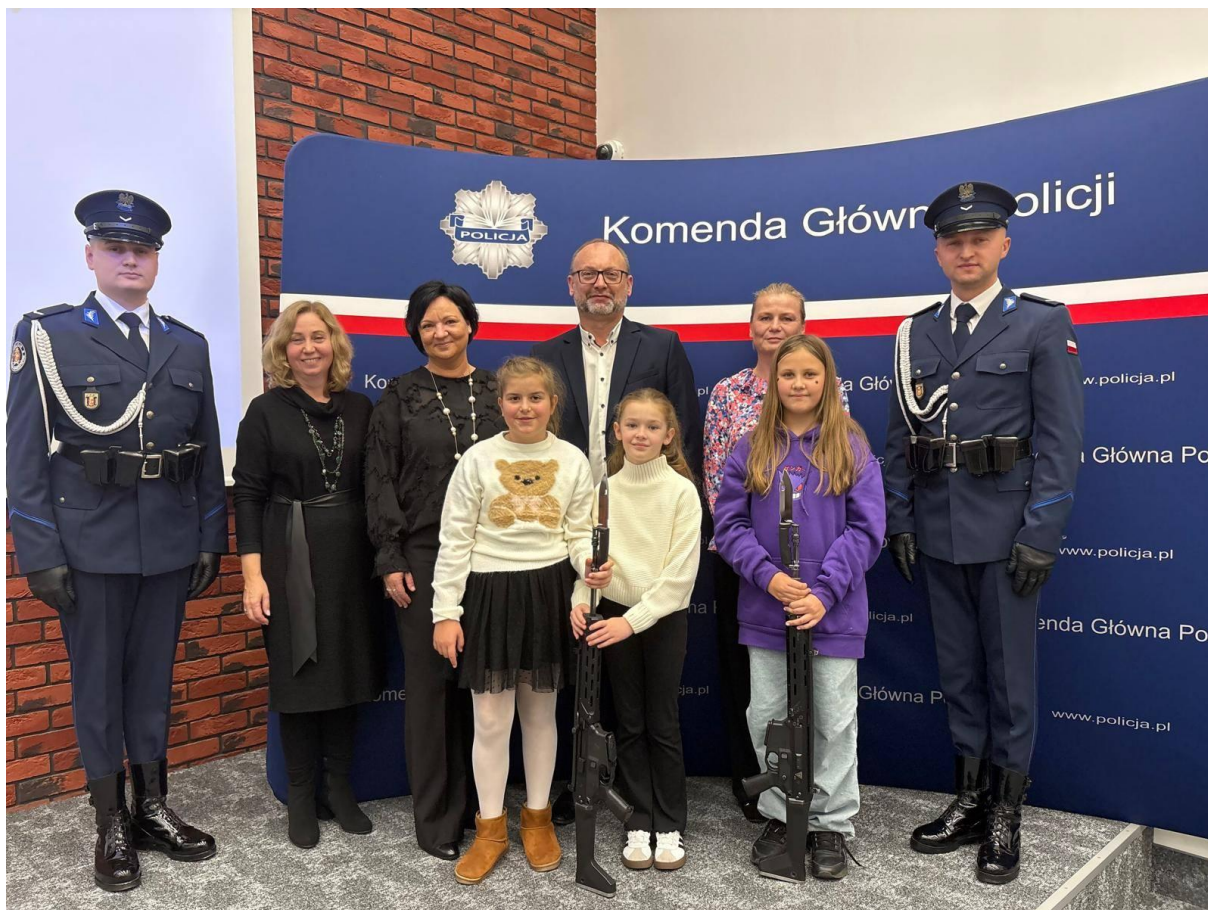
nagroda główną w kategorii I – spot filmowy w ogólnopolskim konkursie „Letni Przewodnik”