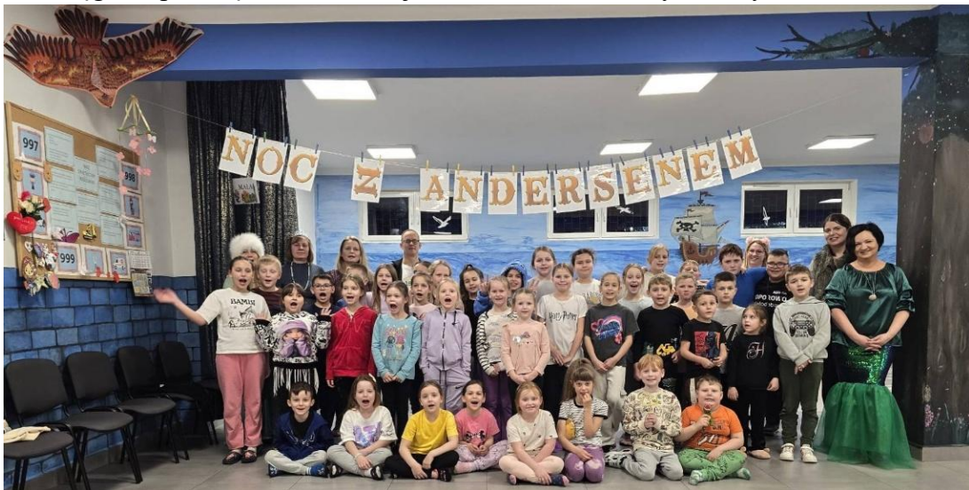
Noc z Andersenem

29 marca w Bibliotece Publicznej w Kazimierzy Wielkiej odbyła się „Noc z Andersenem” – wydarzenie czytelnicze skierowane do najmłodszych czytelników, nawiązujące do twórczości Hansa Christiana Andersena oraz obchodzonego na całym świecie Międzynarodowego Dnia Książki dla Dzieci. W programie znalazły się m.in. wspólne czytanie baśni, gry i zabawy literackie, konkursy oraz zajęcia plastyczne inspirowane twórczością pisarza. Spotkanie przebiegło w radosnej i twórczej atmosferze, zachęcając dzieci do sięgania po książki oraz rozwijania zainteresowań czytelniczych.