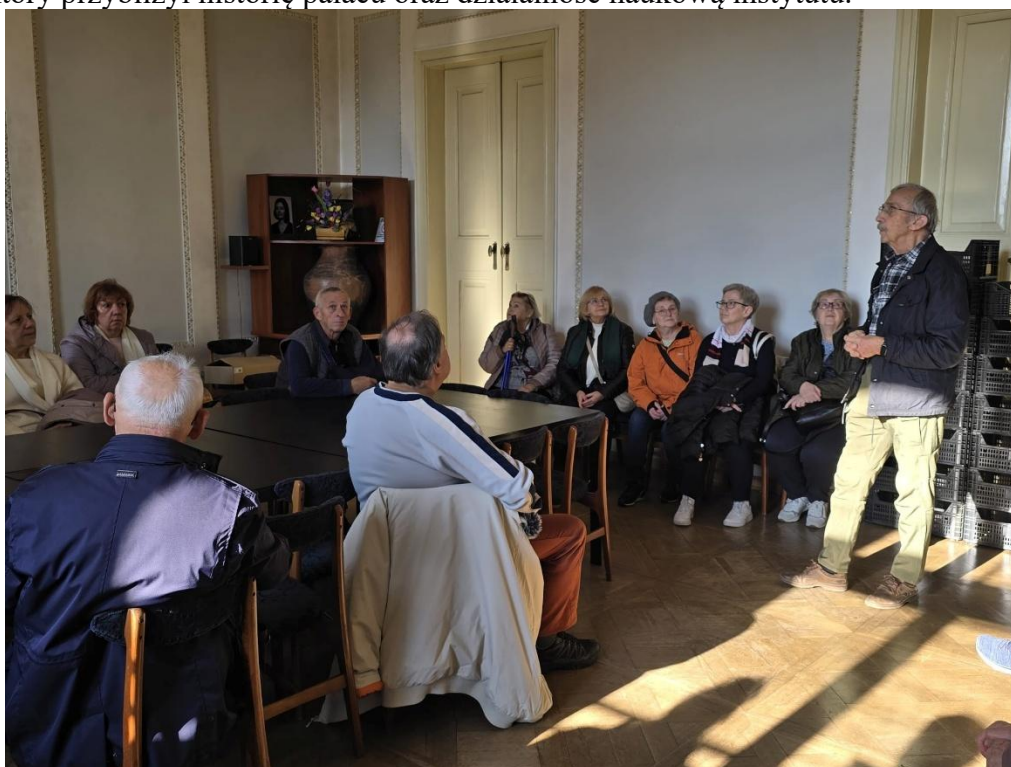
Wizyta w Pałacu Wodzickich w Igołomii