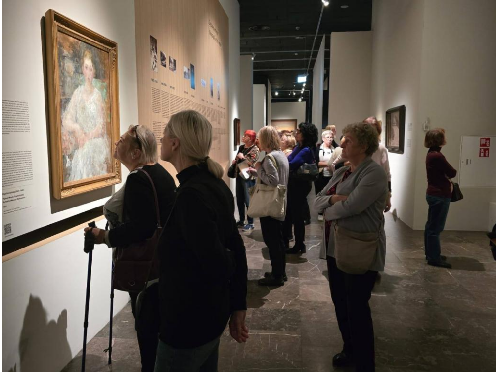
Muzeum Narodowe w Krakowie: wystawa Chełmońskiego

- wykład „Na drodze do Niepodległej” – Instytut Pamięci Narodowej